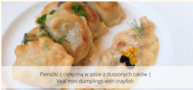
Pierozki z cielęciną w sosie z duszonych raków | Veal mini dumplings with crayfish