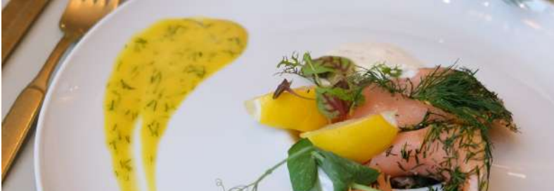
Łosoś: wędzony / z koperkiem / z cytryną z sosem chrzanowym i miodowo-musztardowym | Salmon; smoked / with dill / with lemon with horseradish and honey-mustard sauce