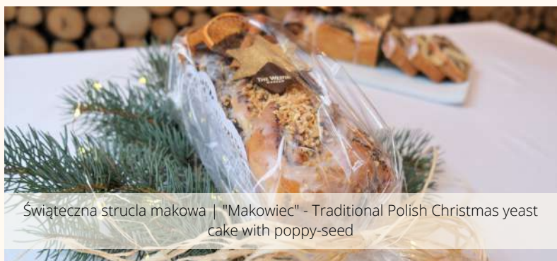
Świąteczna strucla makowa | "Makowiec" - Traditional Polish Christmas yeast cake with poppy-seed