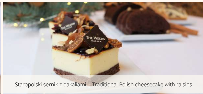
Staropolski sernik z bakaliami | Traditional Polish cheesecake with raisins