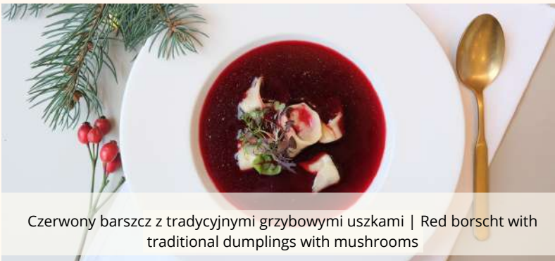
Czerwony barszcz z tradycyjnymi grzybowymi uszkami | Red borscht with traditional dumplings with mushrooms