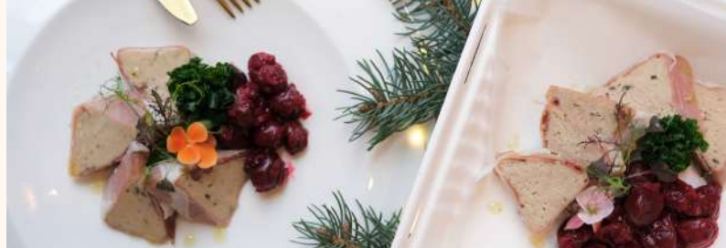
Terina z kaczki z konfiturą z wiśni i imbiru | Homemade duck terrine with cherry and ginger jam