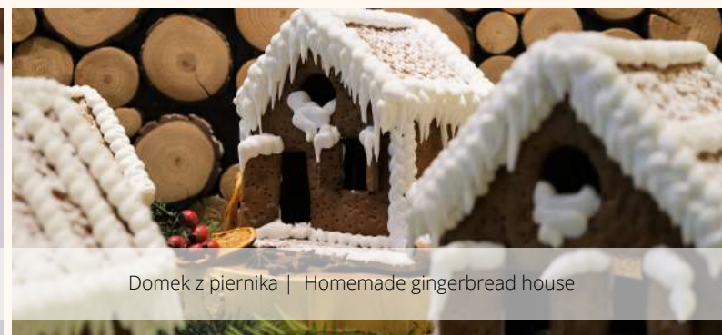
Domek z piernika | Homemade gingerbread house