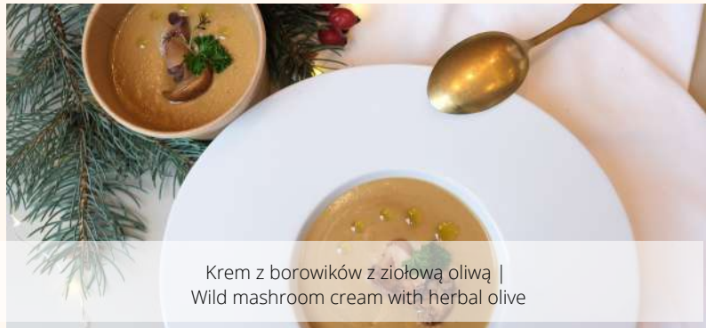
Krem z borowików z ziołową oliwą | Wild mushroom cream with herbal olive