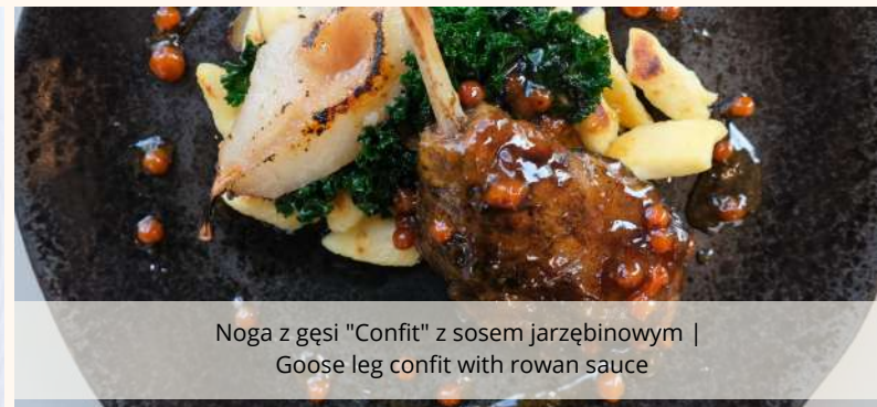
Noga z gęsi "Confit" z sosem jarzębinowym | Goose leg confit with rowan sauce