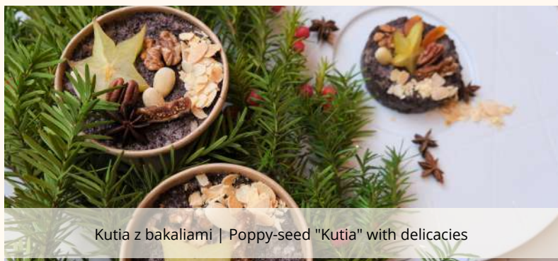
Kutia z bakaliami | Poppy-seed "Kutia" with delicacies