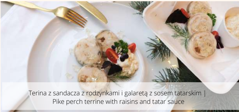
Terina z sandacza z rodzynkami i galaretką z sosem tatarskim | Pike perch terrine with raisins and tatar sauce